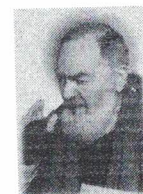
Associazione Padre Pio Servizi Formativi e per il lavoro