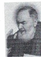
Associazione Padre Pio Servizi Formativi e per il lavoro

Ai fini della selezione, le predette prove saranno effettuate solo se il numero dei presenti alla convocazione sarà superiore ai posti disponibili.