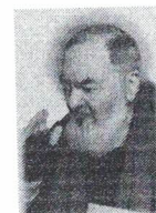
Associazione Padre Pio Servizi Formativi e per il lavoro

Relativamente al corso di formazione dal titolo ADDETTO AL GIARDINAGGIO E ORTOFRUTTICOLTURA , a seguito del superamento, con esito positivo, dell'esame finale, sarà rilasciato l'Attestato di Qualifica.