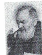
Associazione Padre Pio Servizi Formativi e per il lavoro