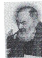
Associazione Padre Pio Servizi Formativi e per il lavoro