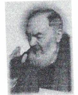
Associazione Padre Pio Servizi Formativi e per il lavoro