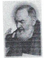
Associazione Padre Pio Servizi Formativi e per il lavoro